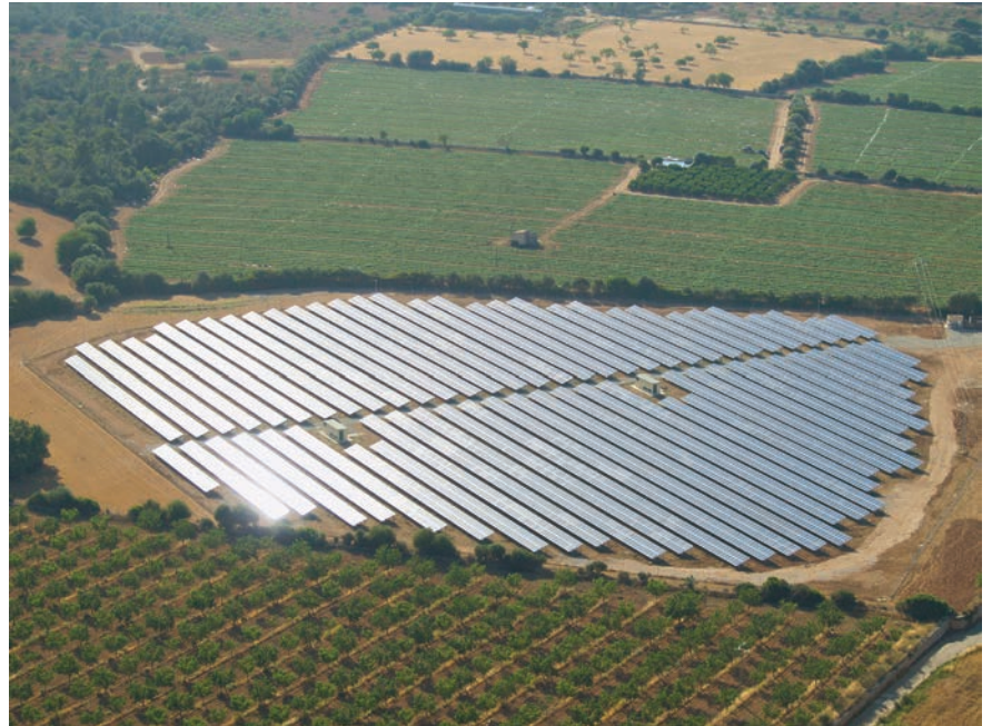
L'installation de Cortadeta fournit de l'électricité pour environ 670 ménages.