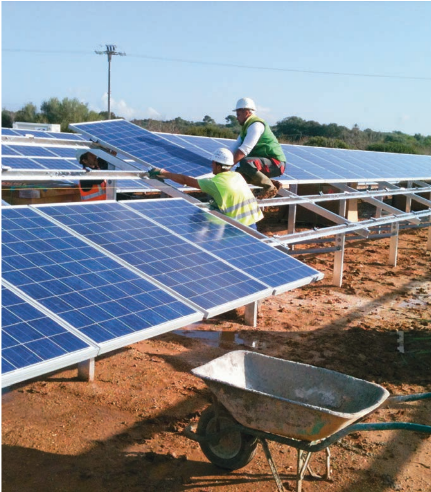
La construction de l'installation de Cortadeta s'est déroulée sans encombre.

conclut: «Les coûts d'investissement se sont élevés à 5.6 millions d'euros. L'installation fonctionnera au moins 25 ans et atteindra un rendement de plus de 10 %.»