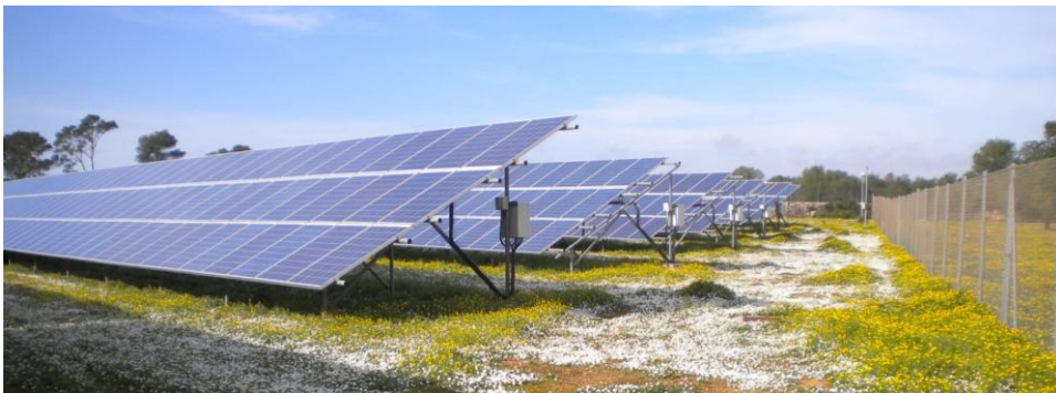
Parc photovoltaïque de Lluçmajor, Majorque, 1.775 MW

Dans le cadre de cet achat, un contrat de financement a été conclu avec la banque CIC (Suisse) pour EUR 5 mio. Outre le financement du parc photovoltaïque, cet accord permet de limiter la dépendance du groupe par rapport à l'euro. Il s'agit d'une étape importante pour un financement du groupe en ligne avec les actifs dans les délais fixés.